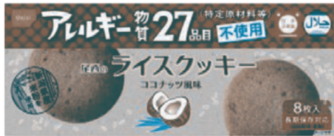
[ライスクッキー(8枚/箱)]